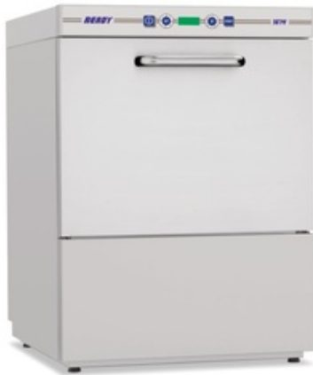
Artikel-Nr.: 20232027 GTIN: 4059395060522

Weitere Einzelheiten und die Kosten erhalten Sie hier .